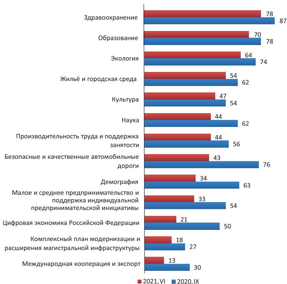
Рисунок 3. Динамика ответов респондентов на вопрос: «Какие национальные проекты, на Ваш взгляд, являются наиболее важными?». (РФ, % от числа опрошенных. Ответы по критерию «Для всего российского общества»)