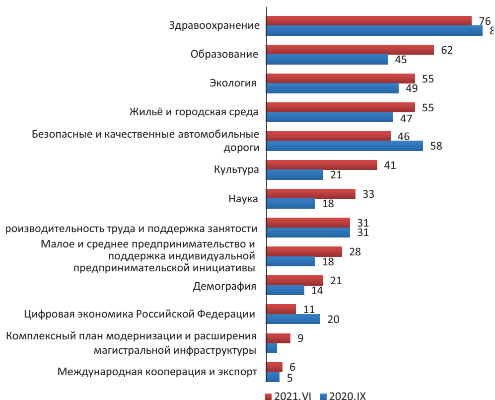
Рисунок 2. Динамика ответов респондентов на вопрос: «Какие национальные проекты, на Ваш взгляд, являются наиболее важными?» (РФ, % от числа опрошенных. Ответы по критерию «Для Вас лично»)