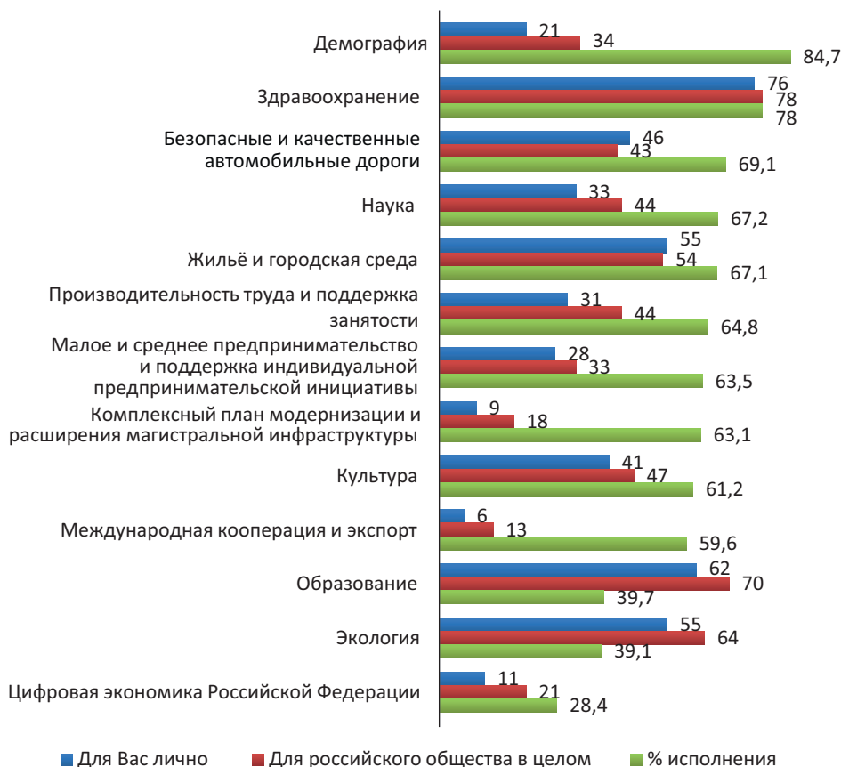
Рисунок 5. Распределение ответов респондентов на вопрос: «Какие национальные проекты, на Ваш взгляд, являются наиболее важными?» в сравнении со степенью исполнения федерального бюджета по национальным проектам на 1 октября 2021 г.

(РФ, % от числа опрошенных; % исполнения расходов федерального бюджета РФ на реализацию национальных проектов в январе-сентябре 2021 года, ранжировано по % исполнения бюджетов).