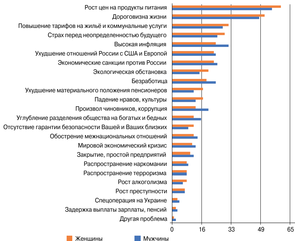
Рисунок 1. Распределение ответов респондентов разного пола на вопрос «Какие проблемы Вас сегодня беспокоят в первую очередь?» (РФ, май 2022 года, % от числа опрошенных каждого пола, n = 1700)

Структура тревожности. Результаты мониторинга в целом демонстрируют динамику изменений, протекающих в социуме. Так, становится видимым влияние проводимой политики гендерного равенства в целом, но на виду оказываются и отдельные ключевые аспекты, в которых проблема неравенства полов проявляется максимально.