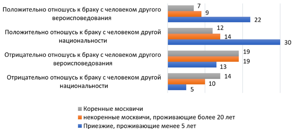
Рисунок 1. Показатели и индикаторы толерантности и интолерантности коренных жителей столицы и приезжих групп населения в отношении этноконфессиональных браков

Следует отметить, что показатели отношения изучаемых групп к некоторым религиям и национальностям напрямую коррелируют с отношением к межконфессиональным и межэтническим бракам (см. табл. 3 пп. 6,7 и рис. 1). Группа «приезжие» более терпима как к другим религиям и национальностям, так и к заключению браков с людьми других конфессий и национальностей.