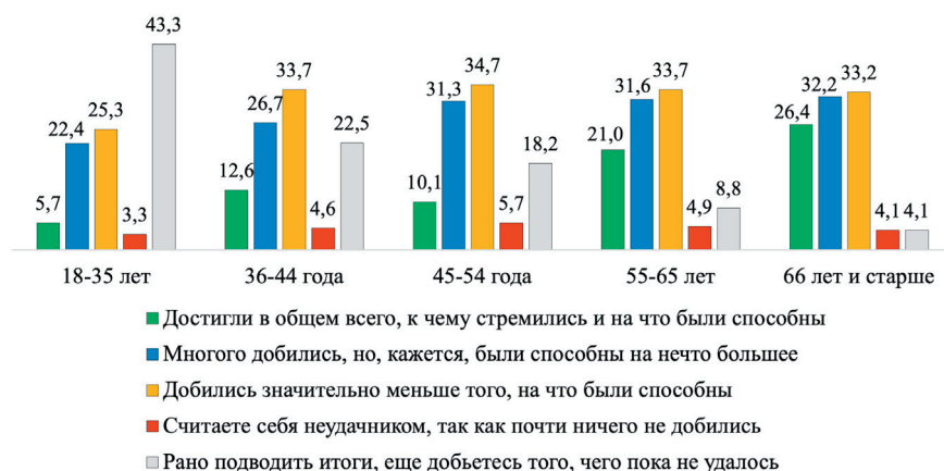
Рисунок 2. Оценки представителей разных возрастных групп россиян степени реализации их жизненных планов, ИС ФНИСЦ РАН, 2023 г., %

Социальная успешность российских граждан оказывается значимо связана с целым рядом их объективных показателей и характеристик (возрастных, образовательных, профессиональных и т.п.). В частности, чем выше занимаемое индивидом положение в различных статусных иерархиях (доходной, профессиональной, образовательной), тем лучше они оценивают степень реализации собственных планов. Сказывается на этих оценках и этап жизненного цикла – в более молодом возрасте человек ориентируется на будущие достижения, а к пожилому возрасту чаще склонен подводить положительные или неутешительные итоги. Кризисным в этом отношении выступает возраст от 45 до 54 лет (рис. 2).