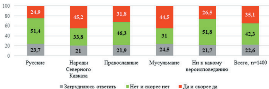
Рисунок 4. Распределение ответов респондентов на вопрос «Считаете ли Вы возможным для себя принять личное участие в конфликте в интересах людей своей национальности?», % от числа опрошенных

Опрос показал наличие потенциальной конфликтности и мобилизационного потенциала конфессиональной идентичности. Так, две трети опрошенных не считают возможным для себя принять личное участие в конфликте в интересах своей религиозной общины — 66,2% (ответы «нет», «скорее нет» и «затрудняюсь ответить»), 33,8% считают возможным своё личное участие (ответы «да» и «скорее да»). Больше всего в конфликтах в интересах своей религиозной общины готовы