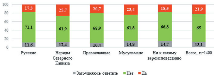
Рисунок 3. Распределение ответов респондентов на вопрос «Сталкивались ли Вы с конфликтной ситуацией, оскорблениями и унижениями, причиной которых была Ваша национальность?», % от числа опрошенных

Для уточнения потенциальной конфликтности межэтнических отношений среди молодёжи и мобилизационного потенциала этничности респондентам был задан вопрос «Считаете ли Вы возможным для себя принять личное участие в конфликте в интересах людей своей национальности?». В ответах две трети опрошенных указали, что не готовы принять личное участие — 64,9% (ответы «нет», «скорее нет» и «затрудняюсь ответить»), треть опрошенных (35,1%) считает возможным принять личное участие в таких конфликтах. Больше всего готовы принять участие в конфликтах респонденты из числа народов Северного Кавказа (45,2%) и мусульмане (44,5%), чем русские (24,9%) и православные (31,8%) (см. рис. 4). Потенциальная конфликтность и мобилизационный потенциал этничности значителен, сохраняется его зависимость от национальной принадлежности молодых людей. Это говорит о существовании рисков конфликтности межэтнических отношений в полиэтничной молодёжной среде.