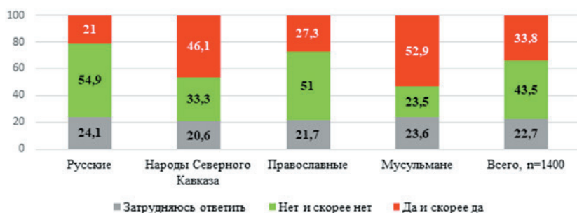
Рисунок 5. Распределение ответов респондентов на вопрос «Считаете ли Вы возможным для себя принять личное участие в конфликте в интересах своей религиозной общины?», % от числа опрошенных

принять участие мусульмане (52,9%) и народы Северного Кавказа (46,1%). Среди русских (21%) и православных (27,3%) потенциальная конфликтность конфессиональной идентичности значительно ниже (см. рис. 5).