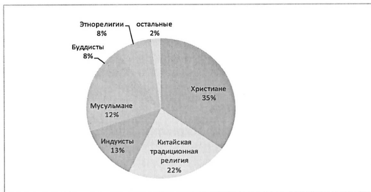
Рис. 1. Доли последователей основных религий в 1910 г., %