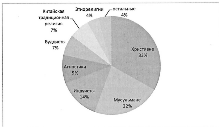
Рис. 2. Доли последователей основных религий в 2010, %

подверглись трансформации. У людей появляется возможность конструировать себе религию из тех символических систем, которые представлены на «религиозном рынке», так называемая религия «à la carte» или «лоскутная религия», или «бриколаж». Сегодня рынок религиозных символов принял глобальный характер, и человек может выбирать компоненты практически из любой религии, религиозной практики. Это яв-