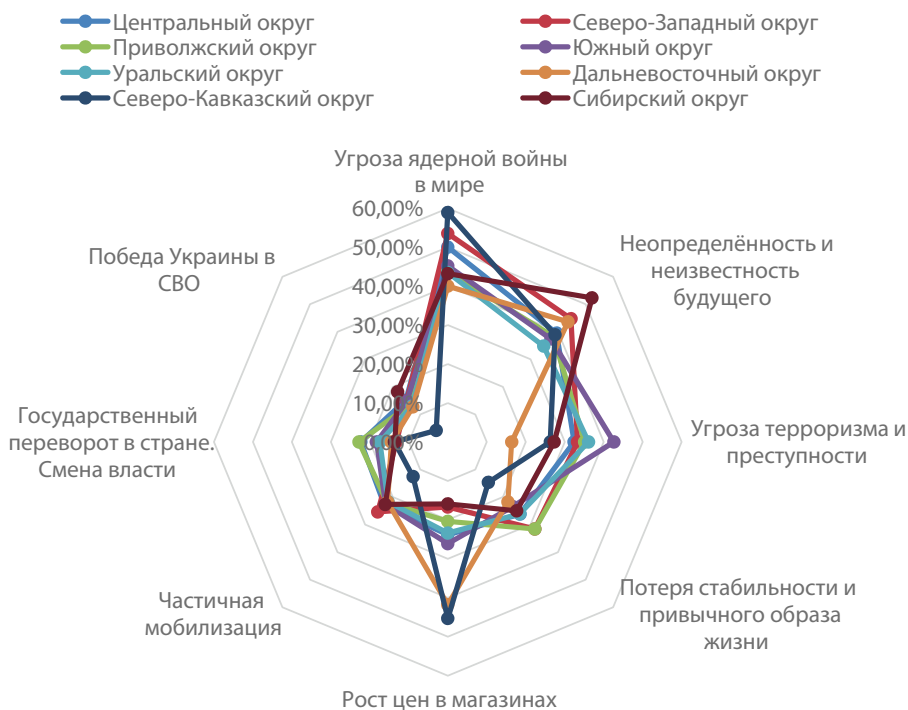
Рисунок 3. Страхи респондентов, группировка ответов в соответствии с регионом проживания респондентов, 2023, %

Как показал опрос, основной страх россиян — это угроза ядерной войны (49%), неопределённость и неизвестность будущего (41%), угрозы терроризма и преступности (34%), потеря стабильности и привычного образа жизни (25%) [23, с. 519]. Повышение цен, инфляция (отметили 23% опрошенных), частичная мобилизация (20%) и государственный переворот (17,7%) беспокоят в гораздо меньшей степени, чем внешняя угроза ядерной катастрофы и терроризма. Симптоматично, что победа Украины в СВО пугает не более 13% опрошенных нами россиян. Рассмотрим теперь, есть ли региональная специфика ответов на вопрос о страхах (см. рис. 3).