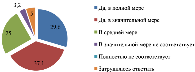
Рисунок 3. Считаете ли Вы, что действующая правовая база обеспечивает полномочия федеральных, региональных и муниципальных органов власти по обеспечению суверенитета Российской Федерации и в какой мере? (в %)