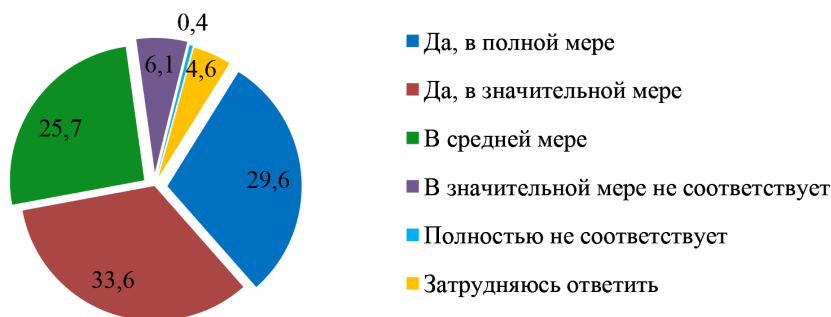
Рисунок 2. Считаете ли Вы, что действующая правовая база обеспечивает полномочия региональных и муниципальных органов власти по защите гарантированных Конституцией РФ прав и свобод граждан и в какой мере? (в %)

Так, в ходе анализа экспертных оценок, полученных по вопросу «Считаете ли Вы, что действующая законодательная база обеспечивает полномочия региональных и муниципальных органов власти по защите гарантированных Конституцией РФ прав и свобод граждан и в какой мере?» выявлена неоднородность экспертного сообщества в плане оценки уровня соответствия правовой базы наиболее полной защите конституционных прав и свобод граждан.