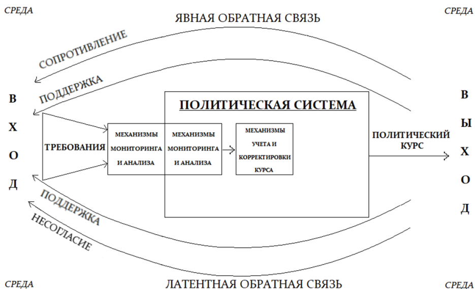
Рисунок 2. Политическая система и политическая обратная связь

Поддержка или несогласие – направленности, обозначенные в латентной обратной связи, могут проявляться, например, в явке на выборы и референдумы, в информации из свободных и независимых СМИ, в отношении общества к представителям власти и выстроенной системе законодательства. Как справедливо подмечено в некоторых исследованиях, недовольство в латентной обратной связи может быть какое-то время даже неосознаваемым и проявляться в таких реакциях, как неуважение граждан к органам власти и закону, социальный нигилизм, низкая мотивация к труду [11].