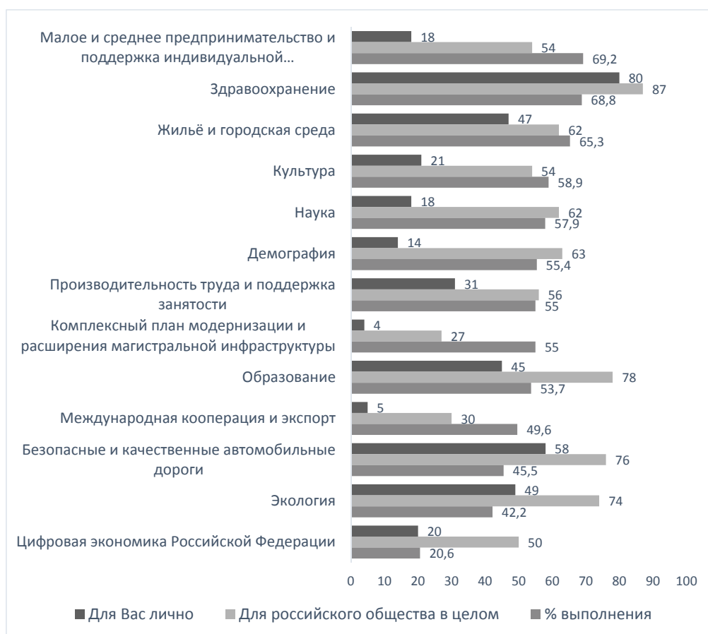
Рисунок 4. Распределение ответов респондентов на вопрос «Какие национальные проекты, на Ваш взгляд, являются наиболее важными?» в сравнении со степенью исполнения федерального бюджета по национальным проектам на 01.10.2020 (РФ, % от числа опрошенных; % исполнения расходов федерального бюджета РФ на реализацию национальных проектов в январе-сентябре 2020 года, ранжировано по % исполнения бюджетов)

Для наглядности на рисунке 3 представлены результаты опросов раздельно по годам, за 2019 и 2020 годы. Определенный интерес может представлять также сравнение оценок респондентов важности национальных проектов в 2020 году с процентом освоения средств на их реализацию к октябрю 2020 года (см. рис. 4).