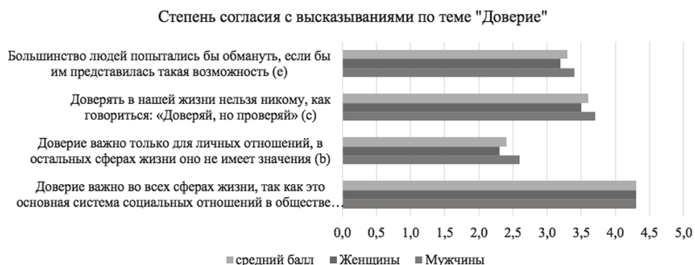
Рисунок 1. Сводная диаграмма оценок степени согласия с высказываниями по теме «Доверие», где 1 совершенно не согласен, а 5 – полностью согласен

Первое, что хотелось бы отметить, большинство участников исследования как мужчины, так и женщины сошлись во мнении, что «Доверие важно во всех сферах жизни, так как это основная система социальных отношений в обществе», согласившись с этим высказыванием в той или иной степени (см. рис. 1).