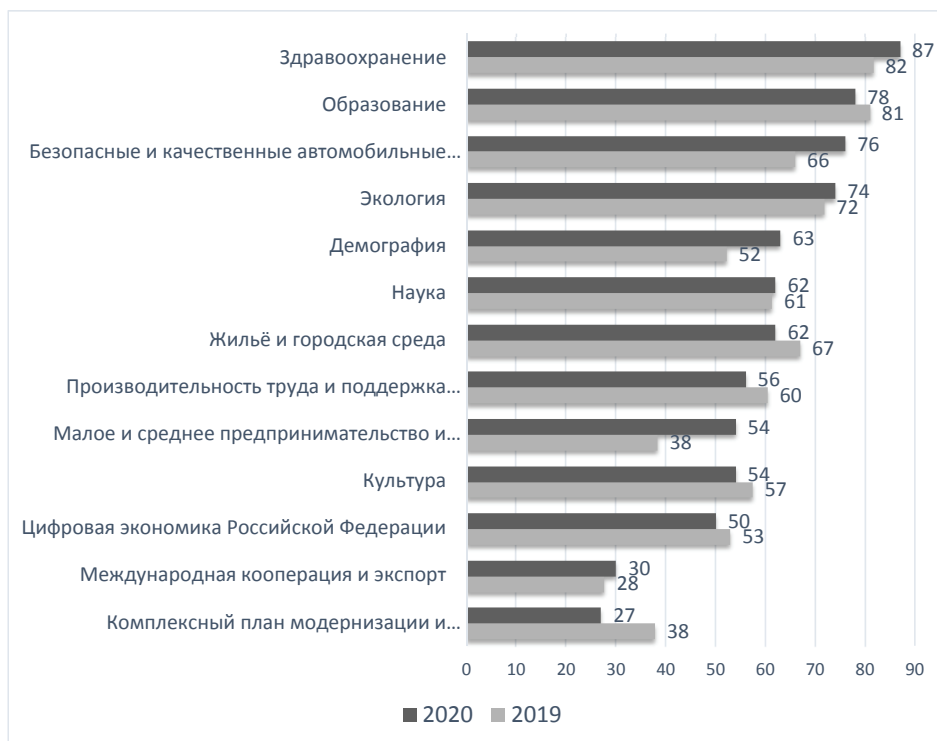
Рисунок 2. Распределение ответов респондентов на вопрос: «Какие национальные проекты, на Ваш взгляд, являются наиболее важными?» (РФ, % от числа опрошенных. Ответы по критерию «Для всего российского общества»)