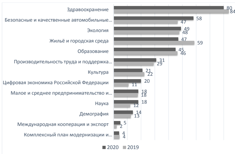
Рисунок 1. Распределение ответов респондентов на вопрос: «Какие национальные проекты, на Ваш взгляд, являются наиболее важными?» (РФ, % от числа опрошенных. Ответы по критерию «Для Вас лично»)