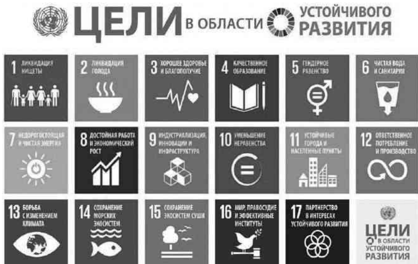
Рис. 1. Источник: Цели устойчивого развития // http://www.globalcompact.ru/index/czeli-ustojchivogo-razvitiya.html

Более всего, миграционная проблематика отражена в целях 4, 5, 8, 10 16 и 17 (см. рис. 1). В них прослеживается связь с миграцией, включая студенческую (образовательную) мобильность, гендерные аспекты, права трудовых мигрантов, проблемы трафика людей, а также содействие упорядоченной, безопасной, регулярной и ответственной миграции и мобильности людей, в том числе путем реализации сбалансированной миграционной политики.