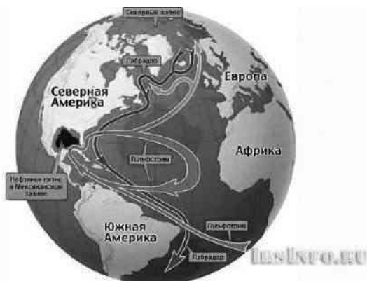
Рис. 1. Схема течения Гольфстрима после техногенной катастрофы [4]

В настоящее время Гольфстрим отклонился на 800 км в сторону Канады. Если течение будет отклоняться и дальше, то ледники Гренландии растают, массы холодной воды наступят на материки, фактически смыв Канаду и Великобританию. Сейчас же в Гренландии тают более 80 ледников, в Арктике в ходе потепления объем льда сократился в три раза, в Антарктиде за 10 лет произошло сокращение льда на 100 миллиардов тонн. Таяние ледников приведет к повышению уровня океанов и морей — всего несколько сантиметров могут привести к появлению ураганов и тропических штормов, несколько десятков сантиметров приведут к затоплению крупнейших прибрежных городов мира. Начнется массовая климатическая миграция, например, жители Африки могут массово мигрировать в Европу [2].