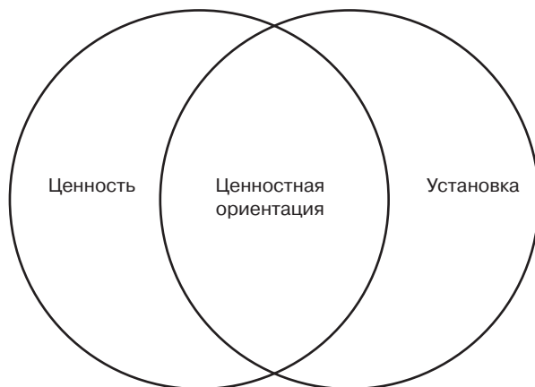
Схема №1 Отношение понятий «ценность», «установка» и «ценностная ориентация».

Существуют установки, которые не базируются на ценностях. Есть ценности, которые человек не принимает, то есть они не становятся его ценностными ориентациями. Ценностные ориентации — это те ценности, которые становятся установками, регулирующими наше поведение.